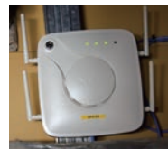
各フロアのバックヤードに無線LANアクセスポイント「MW2201-B」を設置し、客室の無線インターネットを実現。

●最適な無線インターネット環境へ 客室のインターネット接続サービスを無線化・無料化したことで、これまで多かったインターネット環境に対する要望やマイナスコメントが大幅に減り、リピーターのお客様からは喜びの声が届いています。また通信速度は、以前と変わらない上り下り100Mbpsですが、幹線部分をギガ帯域に拡張したため、動画なども無線で快適に視聴できるポテンシャルとなっています。