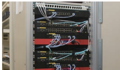
全客室にインターネットとVODを提供するための大規模ネットワークを支える、アクセスコンセントレター「VC2404FE」